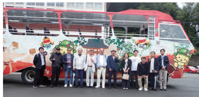
ハッ場ダム水陸両用車