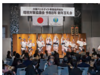
大阪天水連阿波踊り