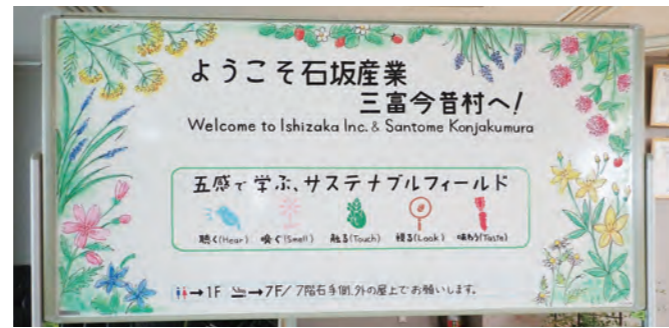
石坂産業(株)ウェルカムボード