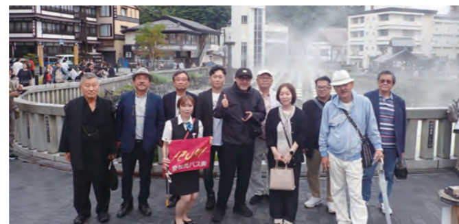
草津温泉湯畑散策