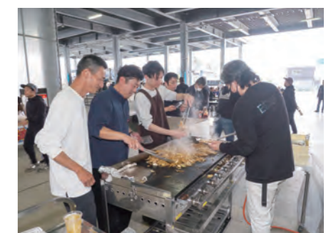
懇親会屋台やきそば