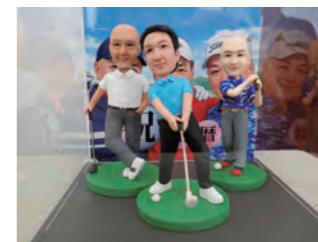
還暦記念フィギュア