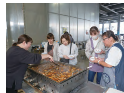
懇親会屋台おでん